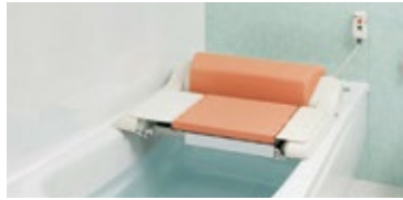
バスリフトの設置可否を判断する浴室の寸法